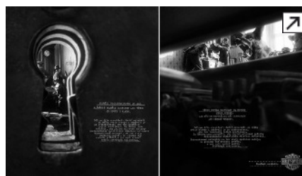
Vizuál Harley-Davidson oceněný na festivalu Cannes Lions.

Absolutním vítězem outdoorové kategorie se stala "gay friendly" kampaň australské banky ANZ od agentury WhyBin/TBWA .